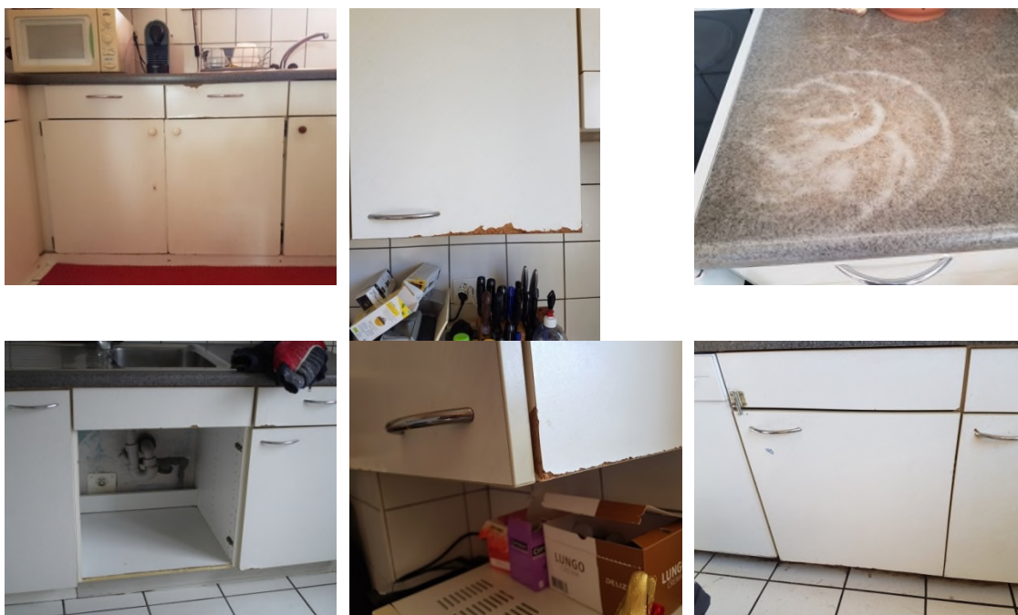
Photos cuisines vétustes Sous-Bois 17-23

L'équipement d'origine est incomplet par rapport aux standards des cuisines actuelles. Elles n'ont pas de lave-vaisselle, même dans les grands appartements, ni de cuisinière avec four et plaques de cuisson. Le seul appareil électroménager inclus est le frigo, qui est encastré dans l'agencement.