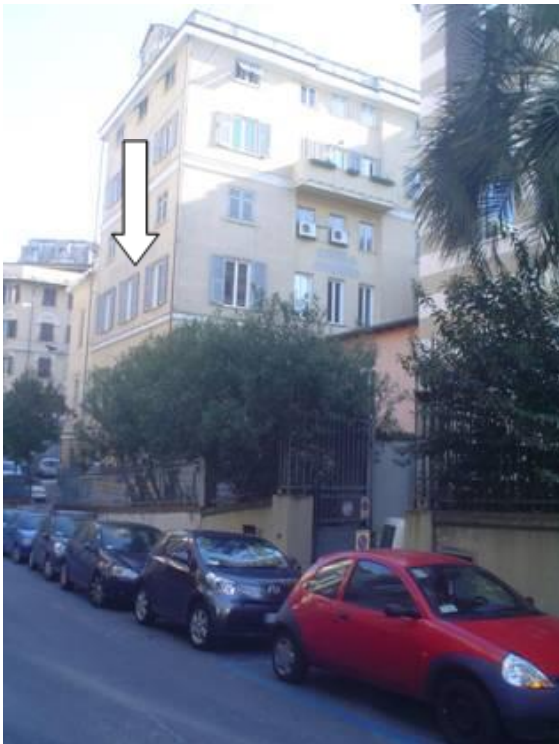
Vue d'en bas (Via Felice Romani). La flèche désigne l'espace no 5 sur le plan (atelier). Entrée côté cour.

Les deux ateliers de la CVC, situés à peine à dix minutes de la gare Brignole et de la zone commerciale (centre-ville), se trouvent dans le bâtiment de l'Unione elvetica (1890). Deux ateliers, ainsi que deux habitations d'env. 20m 2 , une cuisinette (2 plaques électriques) et une petite salle de bain (douche et lavabo) ont été installés au 1 er étage. Les ateliers sont spacieux et lumineux. Dans le plus petit, il y a un évier et il sera de ce fait plutôt destiné aux arts visuels. Dans le plus grand se trouve un piano à queue appartenant au Club helvétique, mais pouvant sans autre être utilisé (voir plan ci-dessous).