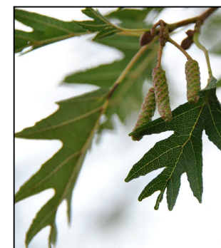
Gleditsia triacanthos "Shademaster"